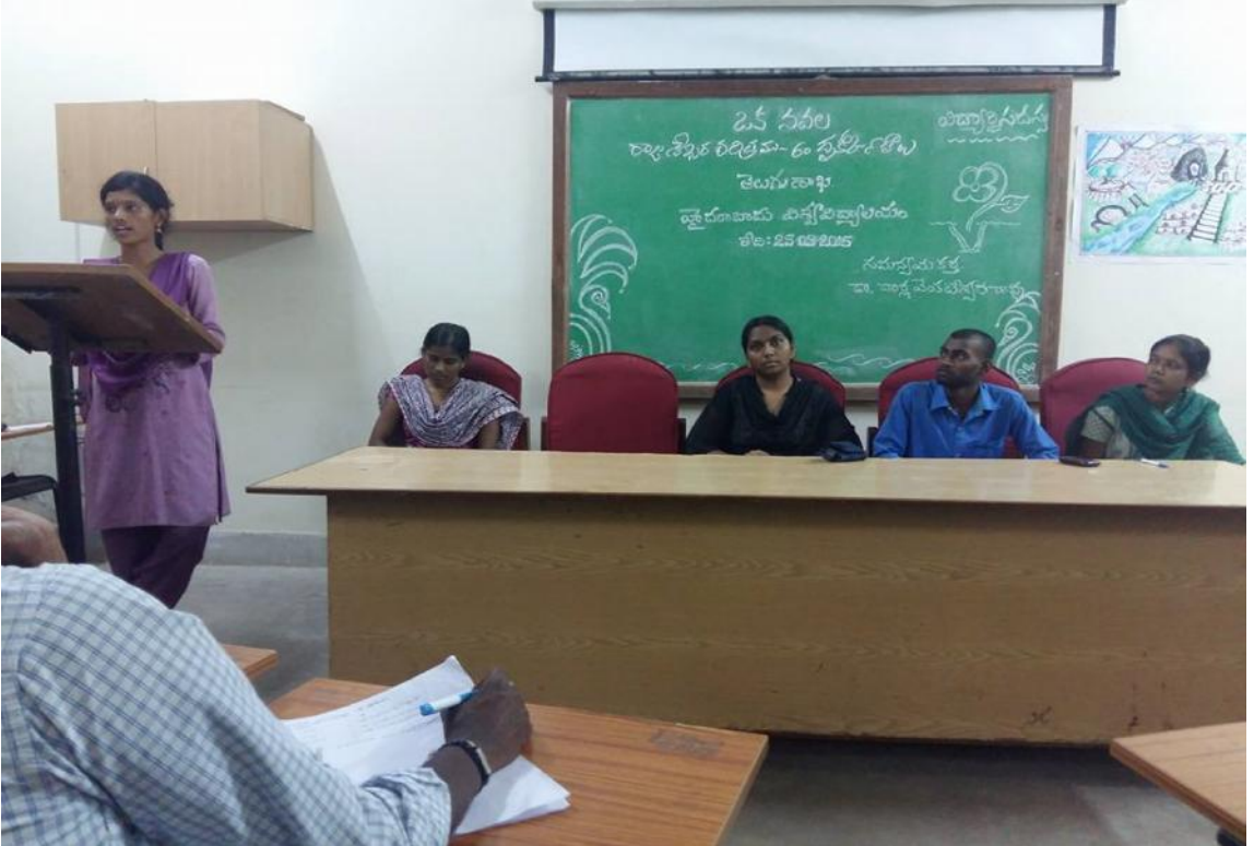
పత్రసమర్పణ చేస్తున్న మమత

రాజశేఖర చరిత్రము నవలలో ఉత్తర ప్రత్యుత్తరాలు కూడా ప్రాధాన్యతను సంతరించుకున్నవని తెలుస్తుంది. ఇందులో మొదటగా ఆరవ ప్రకరణంలో రుక్మిణి భర్త చనిపోయాడన్నది నిజం కాదని, తరువాత అతను మళ్ళీ వచ్చి కనిపించడం ద్వారా మనకు తెలుస్తుంది. అంటే కొన్ని విషయాలు ఊరికే పుట్టిస్తారని ఈ నవల ద్వారా మనకు తెలుస్తుంది. అలాగే సీతపెళ్ళి విషయంలో కూడా ఇలాంటి విధానమే జరుగుతుంది. ఇలా లేని విషయాన్ని పుట్టించడం ద్వారా రుక్మిణి విషయంలో అనర్థం జరిగింది. ఇక్కడ లేని ఉత్తరాన్ని ఉన్నట్టు చూపించడం వల్ల సీత పెళ్ళి విషయంలో మంచి జరిగింది.